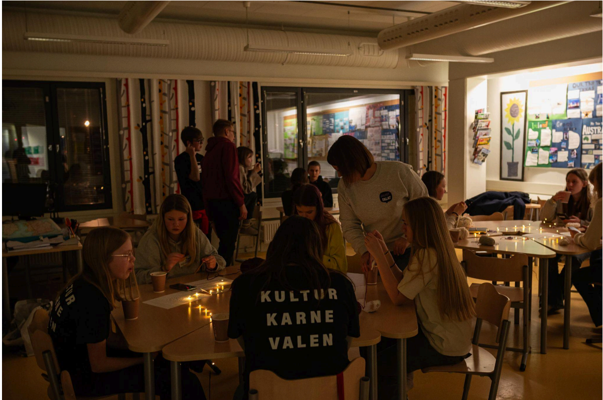
Årligt Talats kvällsprogram på Kulturkarnevalen hösten 2023 i Vasa.

kvällsprogram för deltagarna på Kulturkarnevalen som ordnades i Vasa, samt på Stafettkarnevalen i Helsingfors och Glöggrundan i Åbo.