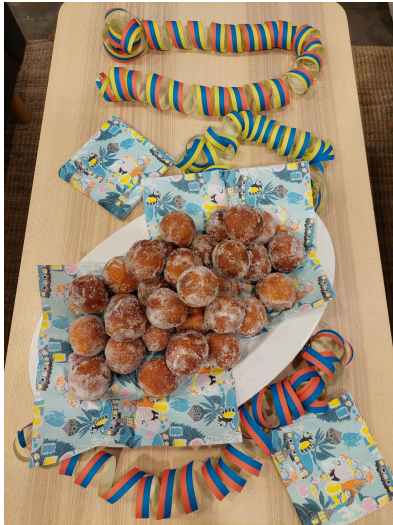
Drop-in vägledning på Helsingfors Luckan för ämnesföreningar vid Helsingfors högskolor och universitet på Valborg.